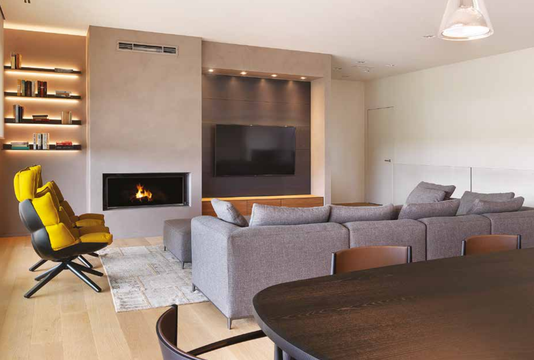
Parete attrezzata con camino e zona TV di Porro e l'utilizzo di una speciale finitura in resina Kerakoll (Negretti Arredamenti). A destra: primo piano del tavolo da pranzo di Porro, il cui spazio è separato dalla cucina tramite un elegante serramento scorrevole a scomparsa di Rimadesio; a soffitto sospensioni di Fontana Arte (Negretti Arredamenti).